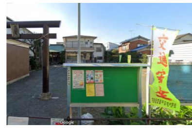
戸手中部会館外観写真